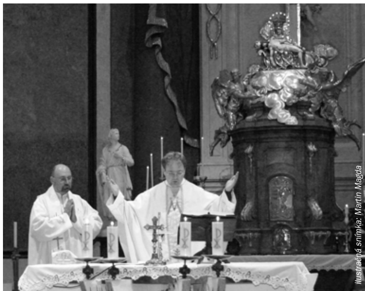
Ilustrácia snímka: Martin Magda