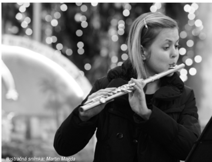
ilustračná snímka: Martin Magda