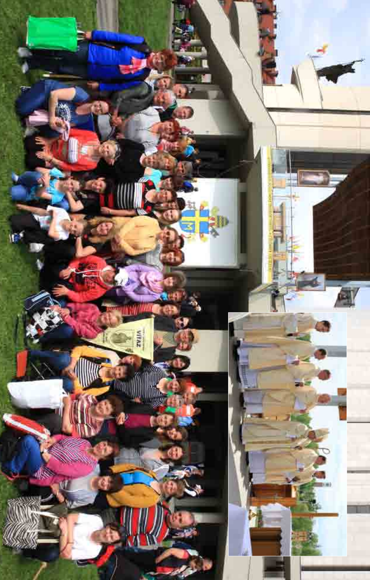
10. máj 2015 - 11. rozhlasová púť Rádia Lumen do Sanktuária Božieho Milosrdenstva v Krakove