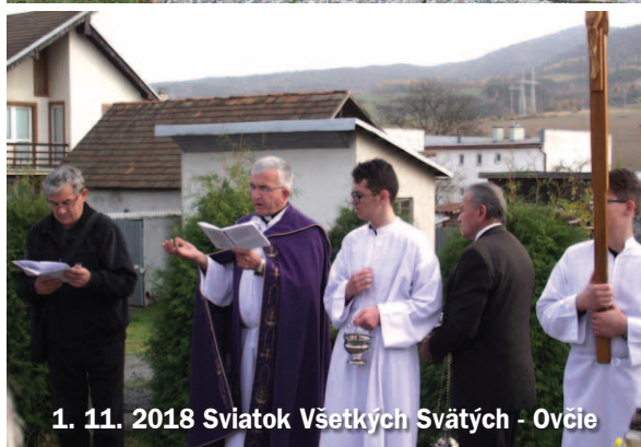
1. 11. 2018 Sviatok Všetkých Svätých - Ovcie