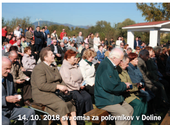
14. 10. 2018 sv. omša za poľovníkov v Doline