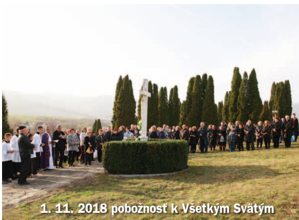
1. 11. 2018 pobožnosť k Všetkým Svätým