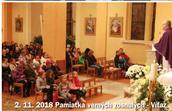
2. 11. 2018 Pamiatka verných zosnulých - Vítaz