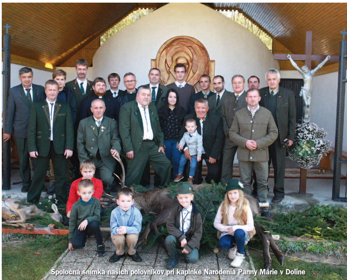
Spoločná snímka našich poľovníkov pri kaplnke Narodenia Panny Márie v Doline