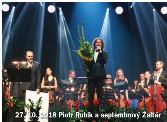
27. 10. 2018 Piotr Rubik a septembrový Žaltár