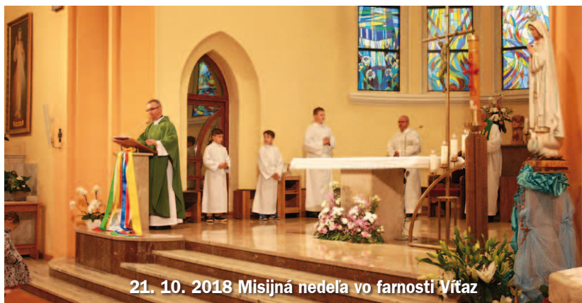
21. 10. 2018 Misijná nedela vo farnosti Vítaz