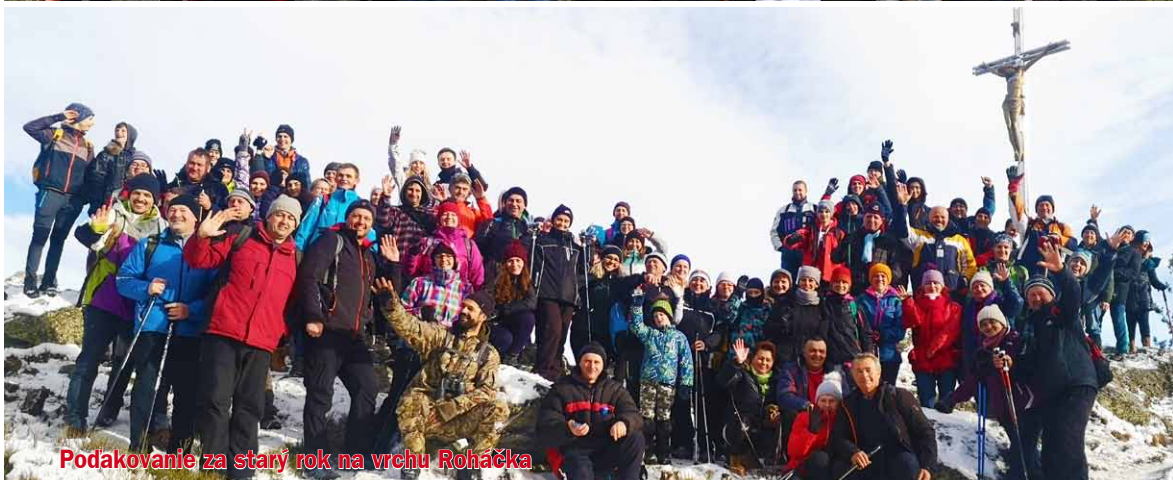
Podakovanie za starý rok na vrchu Roháčka