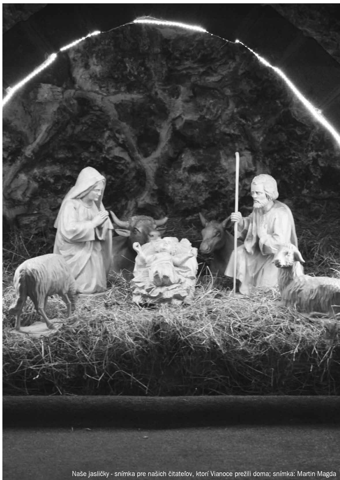
Naše jasličky - snímka pre našich čitateľov, ktorí Vianoce prežili doma