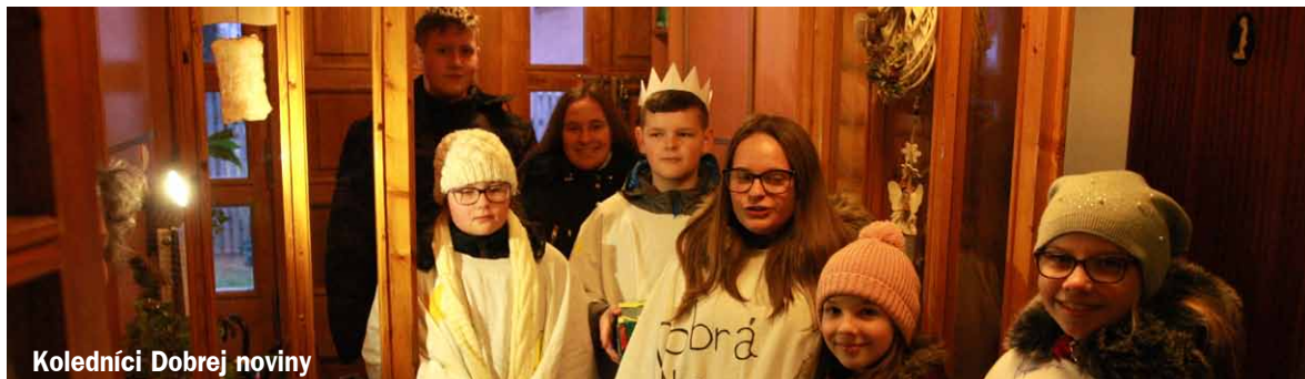
Koledníci Dobrej noviny