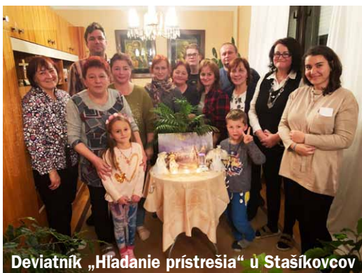
Deviatník „Hľadanie prístrešia“ u Stašíkovicov