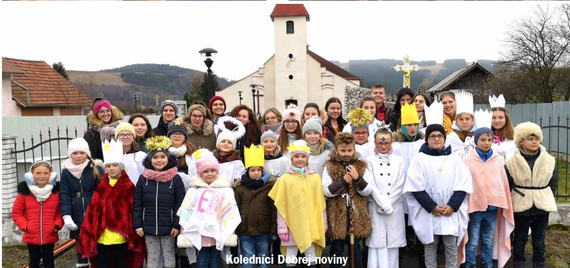
Koledníci Dobrej noviny