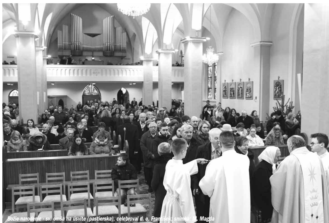
Božie narodenie - sv. omša na úsvite (pastierska), celebraval d. o. František