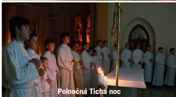
Polnočná Tichá noc