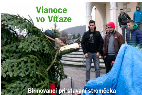
Vianoce vo Vítaze