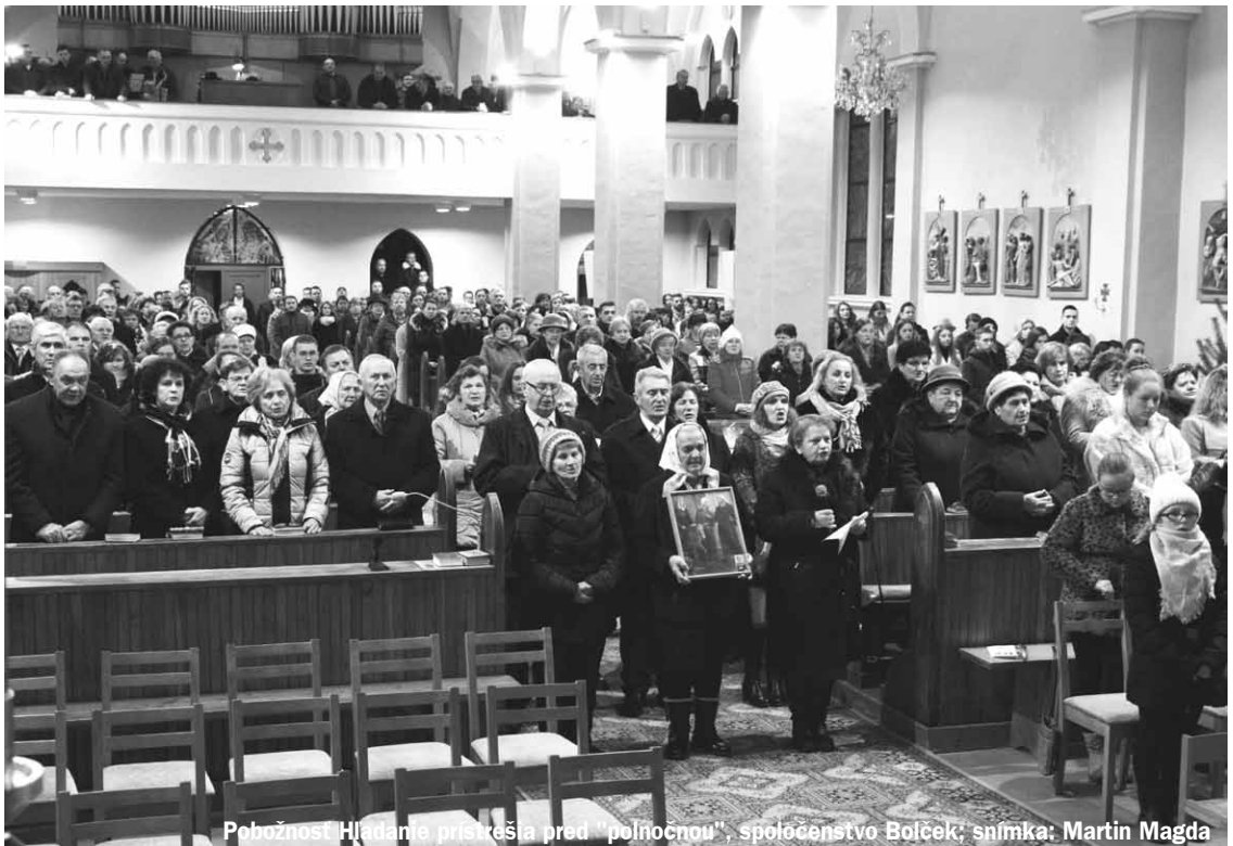
Pobožnosť Hľadanie prískreša pred "poľnocnou", spoločenstvo Boľček; snímka: Martin Magda

Skúsme si v tomto novom roku čím častejšie opakovať slová tohto žalmu a bude sa nám žiť ľahšie. Písmo v tomto žalme tvrdí a možno je to pre niekoho prekvapujúce, že Boh nedopustí, aby nám niečo chýbalo. Slo-