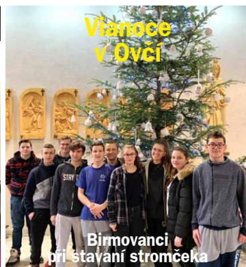
Birmovanci pri stavaní stromčeka