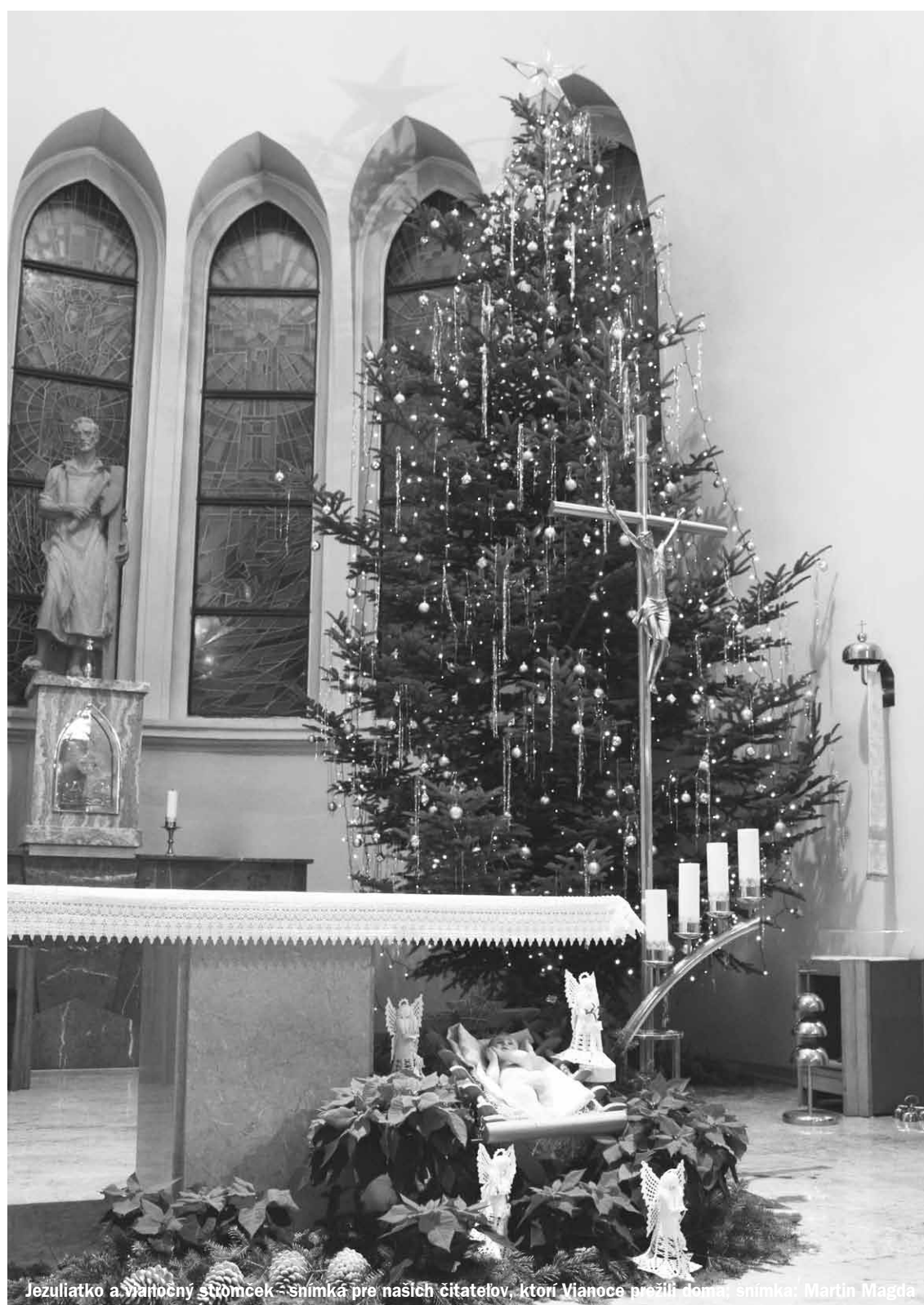
Jezuliatko a vianočný stromček - snímka pre našich čitateľov, ktorí Vianoce prežili doma