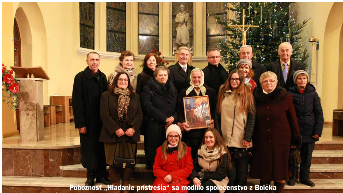
Pobožnosť „Hľadanie prístrešia“ sa modlilo spoločenstvo z Bolčka