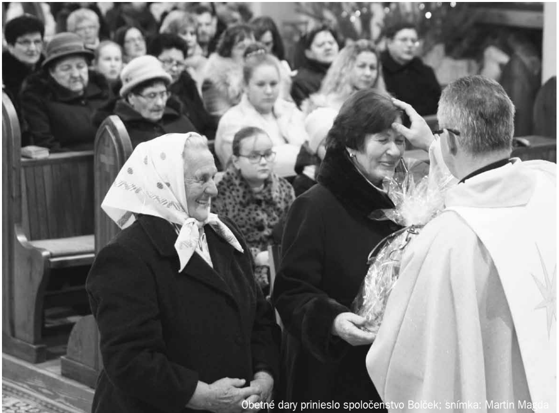
Obetné dary prinieslo spoločenstvo Bolček

Naše vnútro je niekedy veľmi zaťažené tým, že sa nám nedarí, tým,