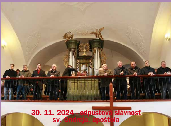
30. 11. 2024 - odpustová slávnosť sv. Ondreja, apoštola