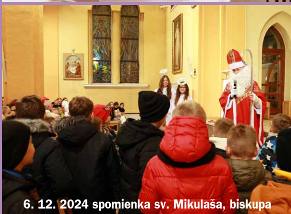
6. 12. 2024 spomienka sv. Mikulaša, biskupa