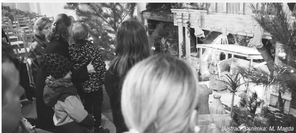
Ilustračná snímka: M. Magda