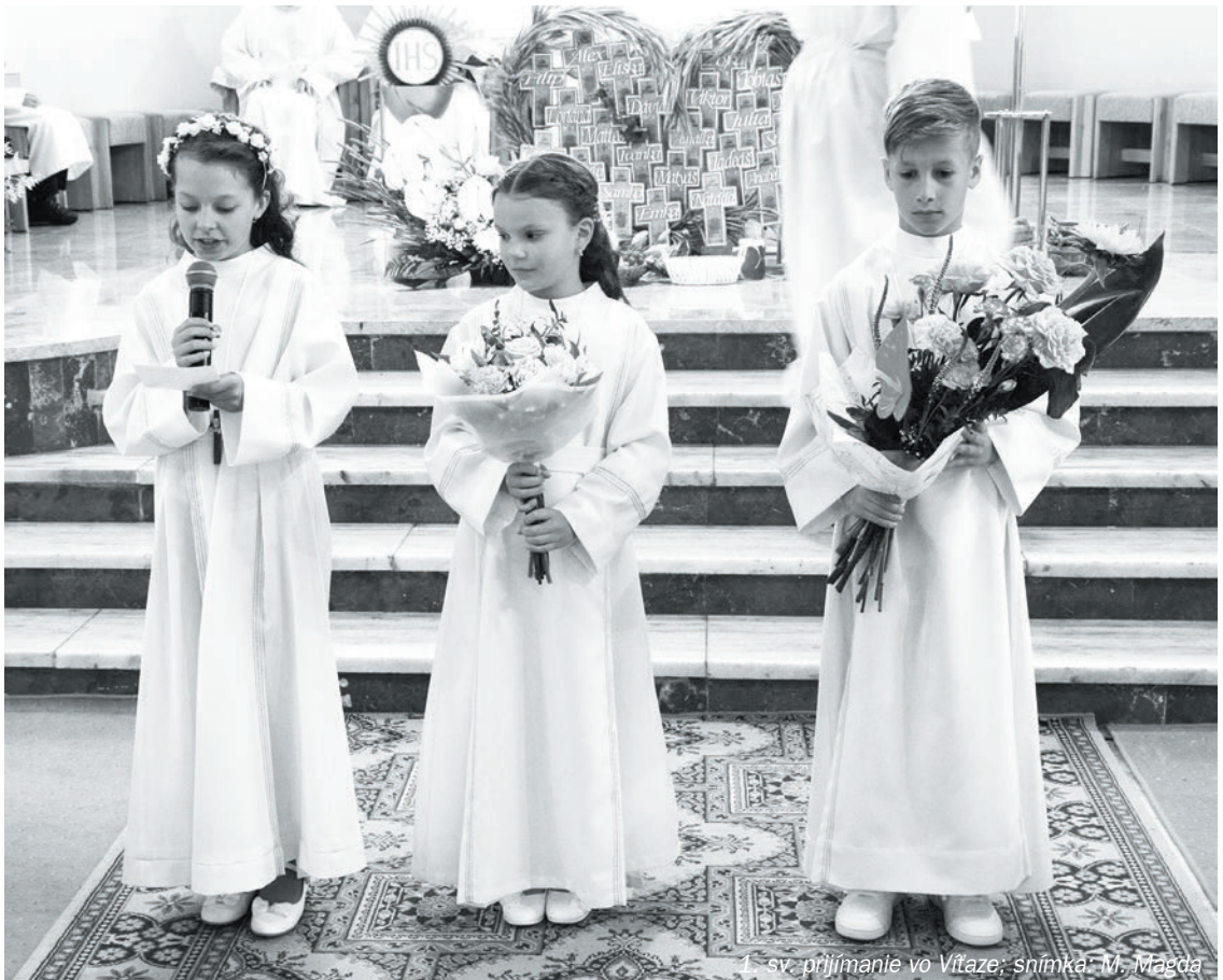
1. sv. prijímanie vo Vítaze

Chlapci a dievčatá, čo hovoríte na túto Jurkovu múdrosť? Vy ju všetci taktiež máte, inak by ste tu dnes neboli. Len prosme Pána Boha častejšie, aby sme túto múdrosť niekedy nestratili. Amen.