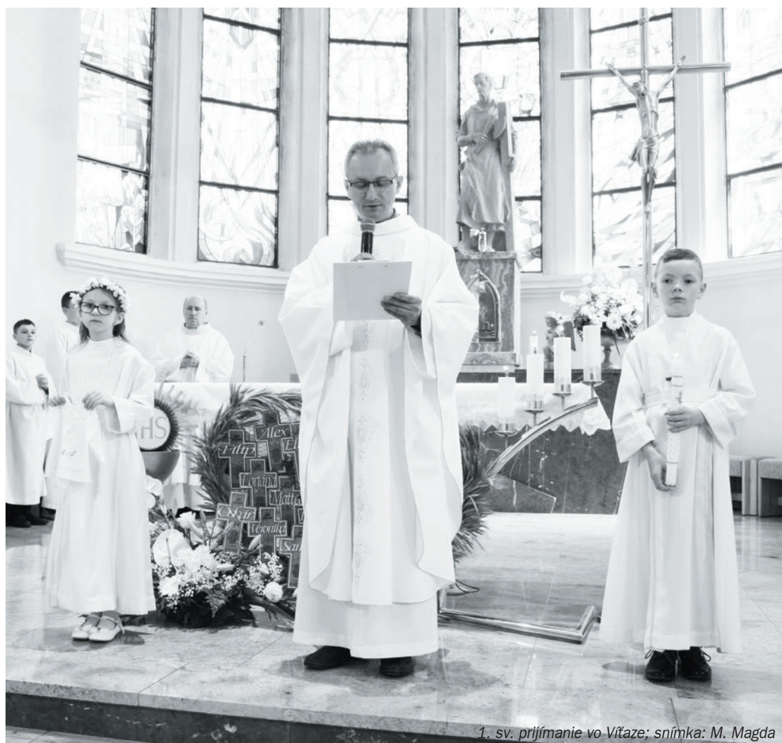
1. sv. prijímanie vo Vítaze

za Noemových dní, čakal, kým nebol postavený koráb.