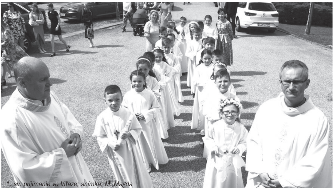
1. sv. prijímanie vo Vítaze