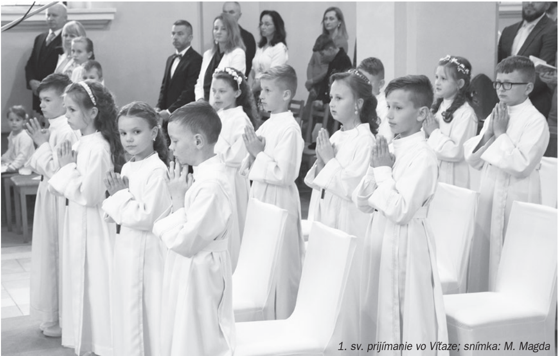
1. sv. prijímanie vo Vŕžaze; snímka: M. Magda

prijímali tento pokrm, patrične pripravení, aby sme nemali myseľ a srdce prepchaté tým, čo sa s Božím slovom nezrovnáva, aby sme boli vždy dobrou, skyprenou pôdou. Len toto zaručí rozsievачovi radostný úspech.