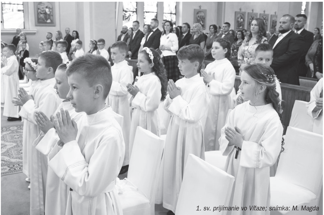
1. sv. prijímanie vo Vítaze

lom aj Božiu trpezlivosť. Boh odďaluje súd, aby dal hriešnikovi čas na obrátenie. Zároveň upozorňuje ľudí, aby nesúdili svojich blížnych. Súd je Božie privilegium. Deň súdu nastane, no nie ihneď, tak ako si to Židia predstavovali. Zatiaľ pláť čas Božej trpezlivosti. Tak ako to napísal aj svätý Peter vo svojom druhom liste: „Nemešká Pán so splnením svojho príslubu, ako sa poniektorí nazdávajú, že mešká, lebo to je zhovievavý kvôli nám. Nechce totiž, aby niektorí zahynuli, ale aby sa všetci kajali.“ Boh pozná veľmi dobre našu ľudskú slabosť, našu krehkosť a je veľmi trpezlivý, čaká, je neobyčajne zhovievavý. Tak ako bol zhovievavý aj