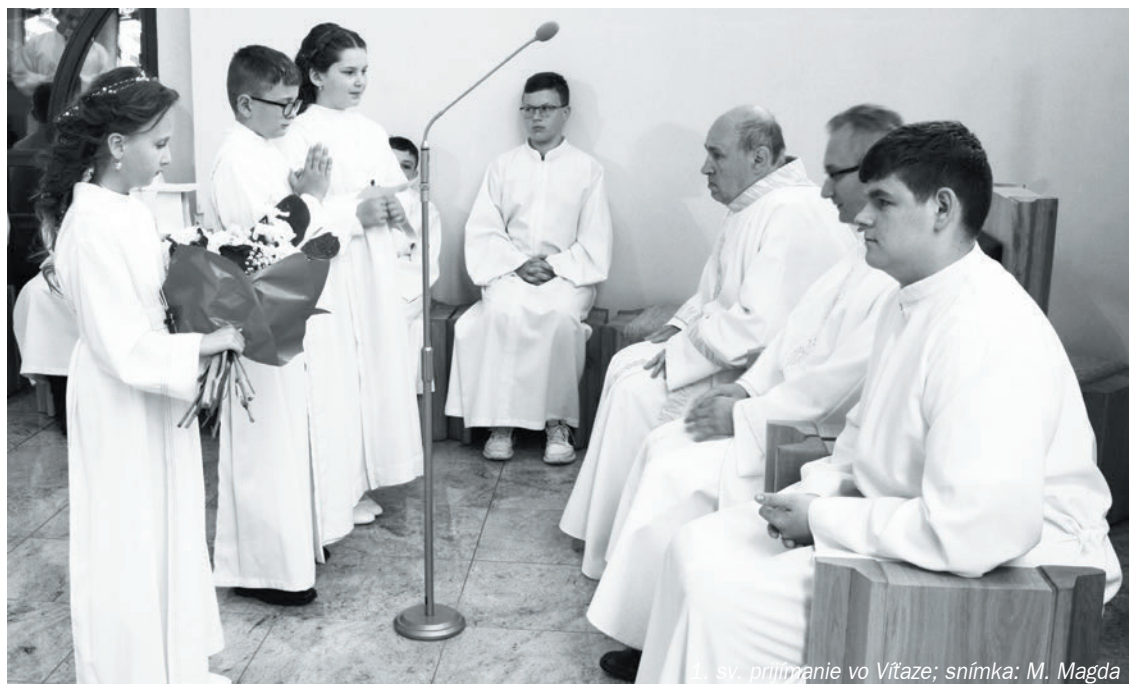
1. sv. prijímanie vo Vítaze

majú skôr nepriateľský postoj voči Cirkvi. Keď idem na oddelenie, neviem, koho stretnem za dverami. Väčšinou pacienti majú záujem o sviatosť, o rozhovor.