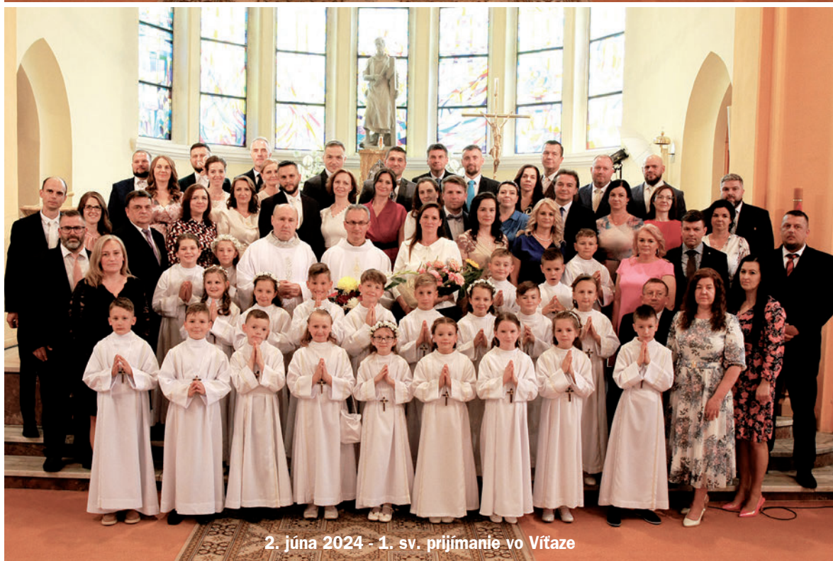
2. júna 2024 - 1. sv. prijímanie vo Vítaze