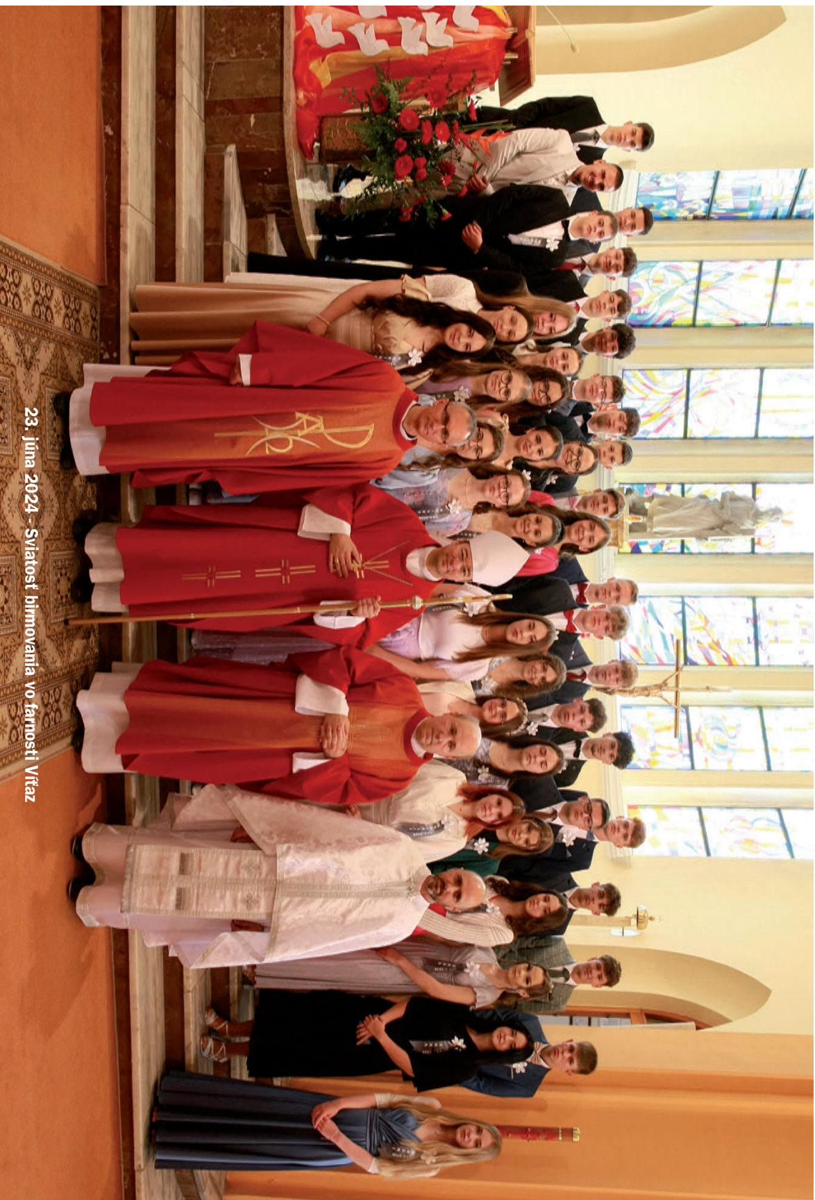
23. júna 2024 - Svätosť birmovania vo farnosti Vrtaz