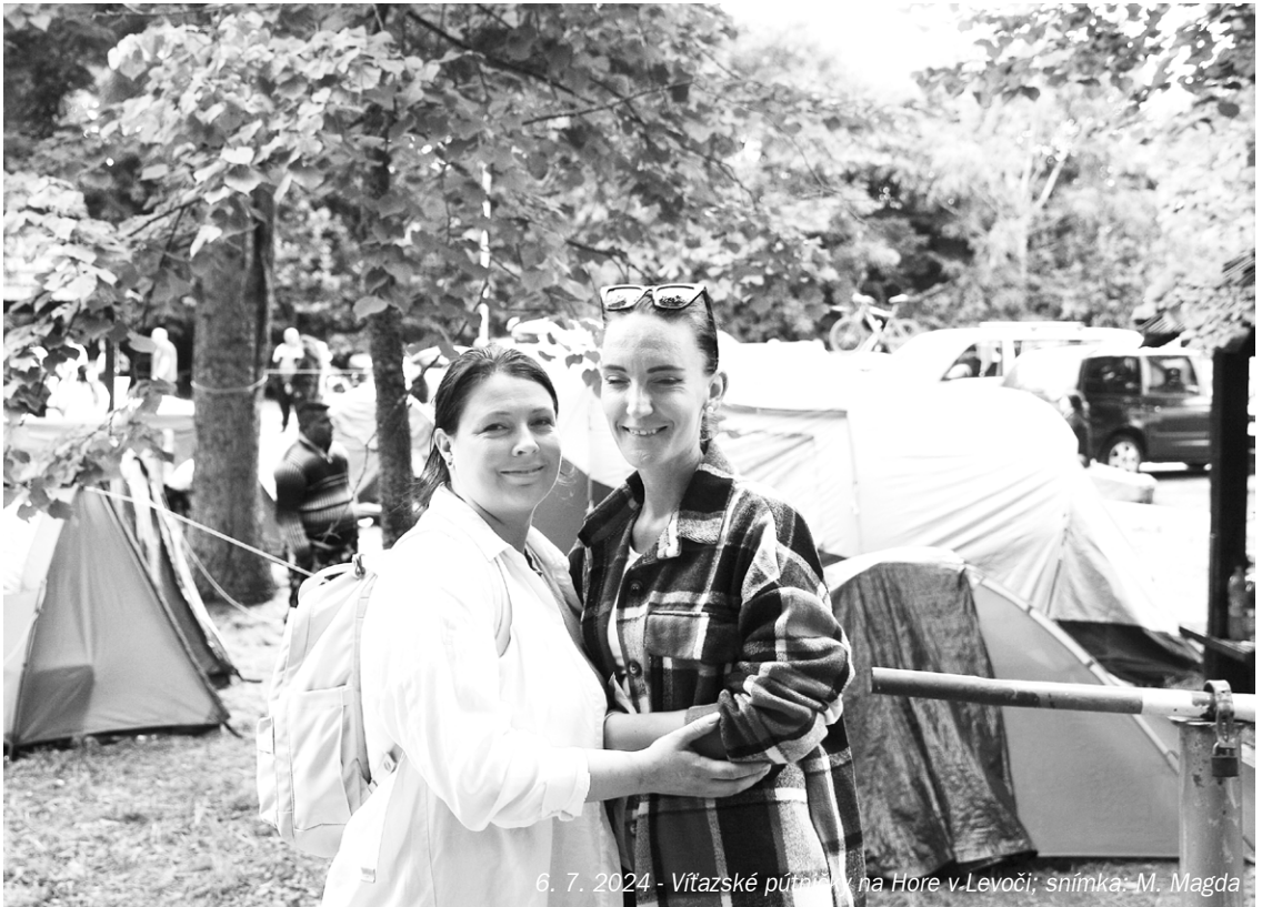
6. 7. 2024 - Víťazské pútníctvo na Hore v Levoči

A tak pomôcť človeku v tiesni bez rozdielu jeho presvedčenia, nie je to pravá zbožnosť svätého Jakuba? Alebo nie je to tá hlavná kresťanská povinnosť? Amen.