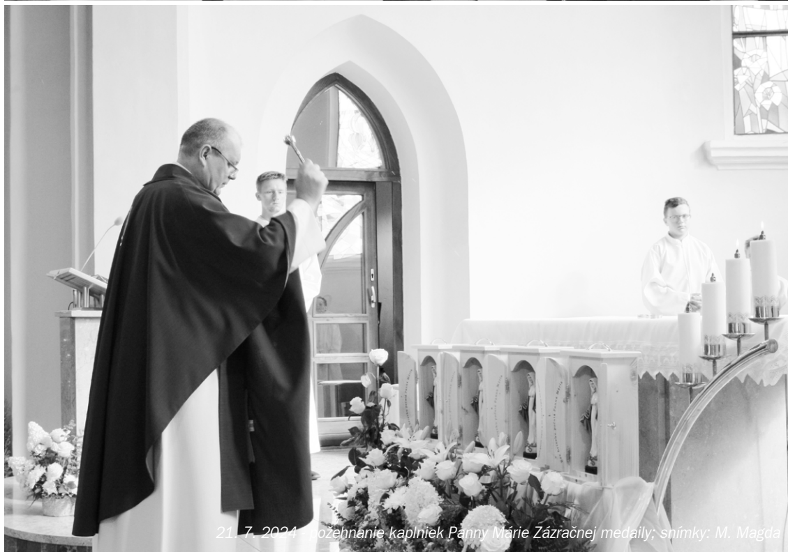
21. 7. 2024. Błogosławienie kapłanek Panny Marii Zázračnej medaili