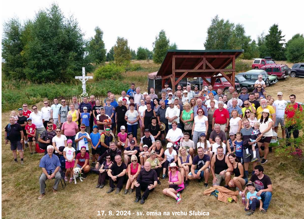
17. 8. 2024 - sv. omša na vrchu Slubica