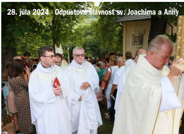
28. júla 2024 - Odpustová slávnosť sv. Joachima a Anny