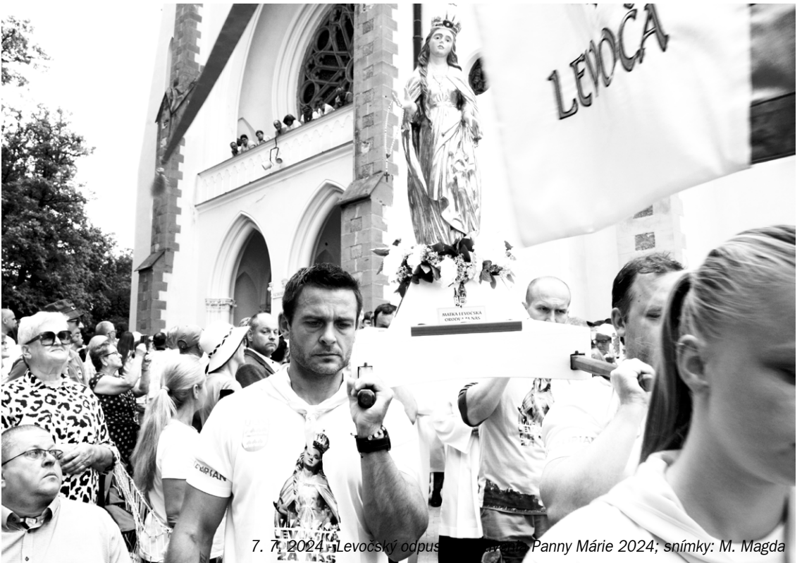
7. 7. 2024 - Levočský odpusť Panny Márie 2024