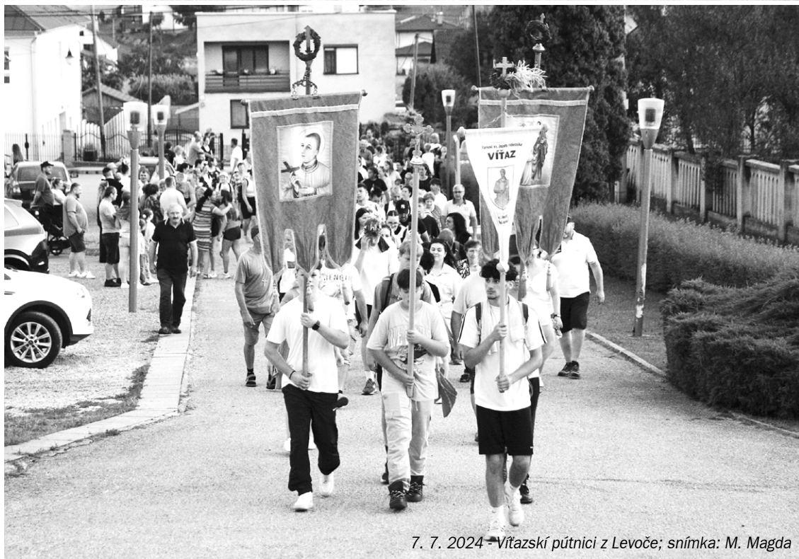
7. 7. 2024 - Víťazskí pútníci z Levoče