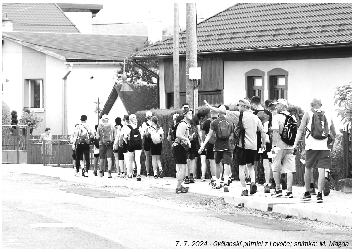
7. 7. 2024 - Ovčianskí pútníci z Levoče