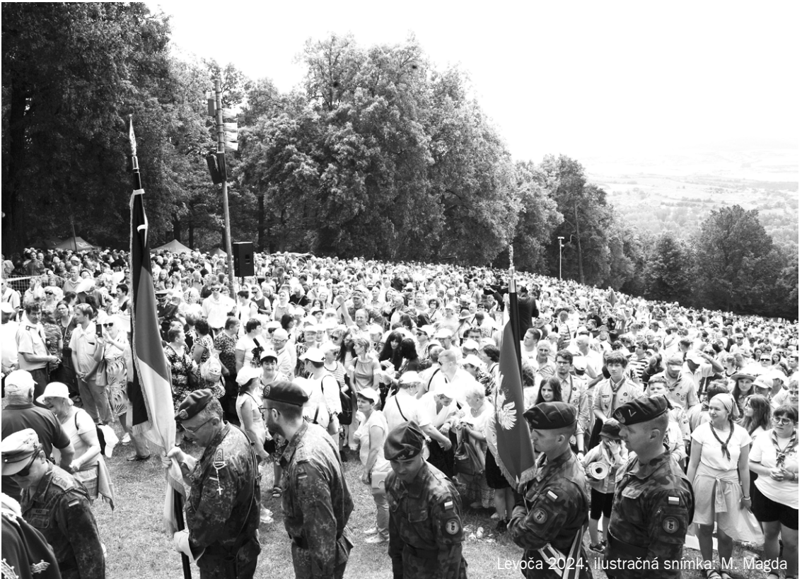
Leviča 2024; ilustračná snímka: M. Magda