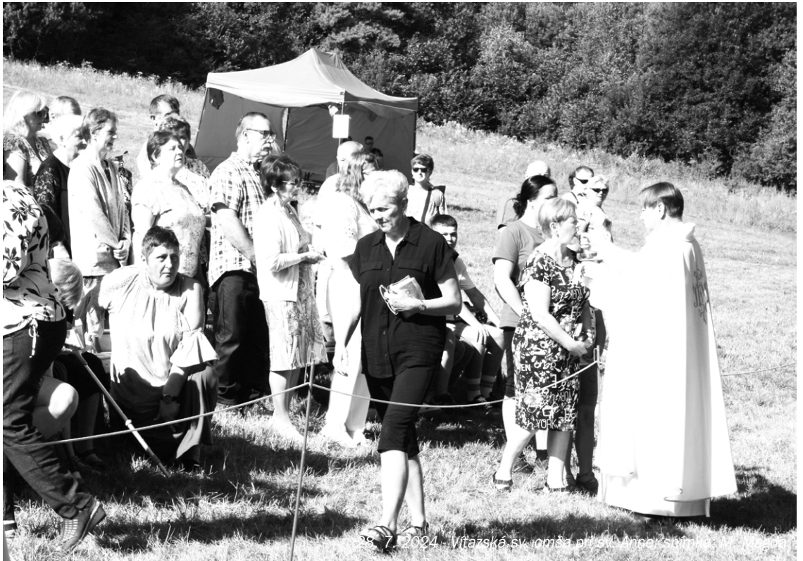
28. 7. 2024 - Vítavská sv. romša při sv. Anny