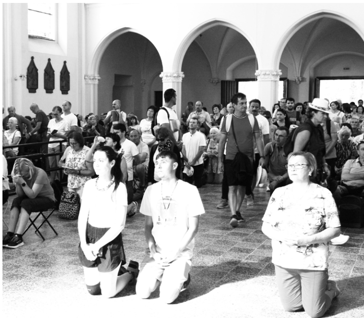
V Bazilike na Levočskej hore; ilustračná snímka: M. Magda

Potom prechádzaš k druhému kroku, ktorým je ďakovanie Bohu a zveľbovanie ho za to, čo očakávaš od Boha, ale ešte to nevidíš. Hovoríš ďalej takto: „Otče, ďaku-