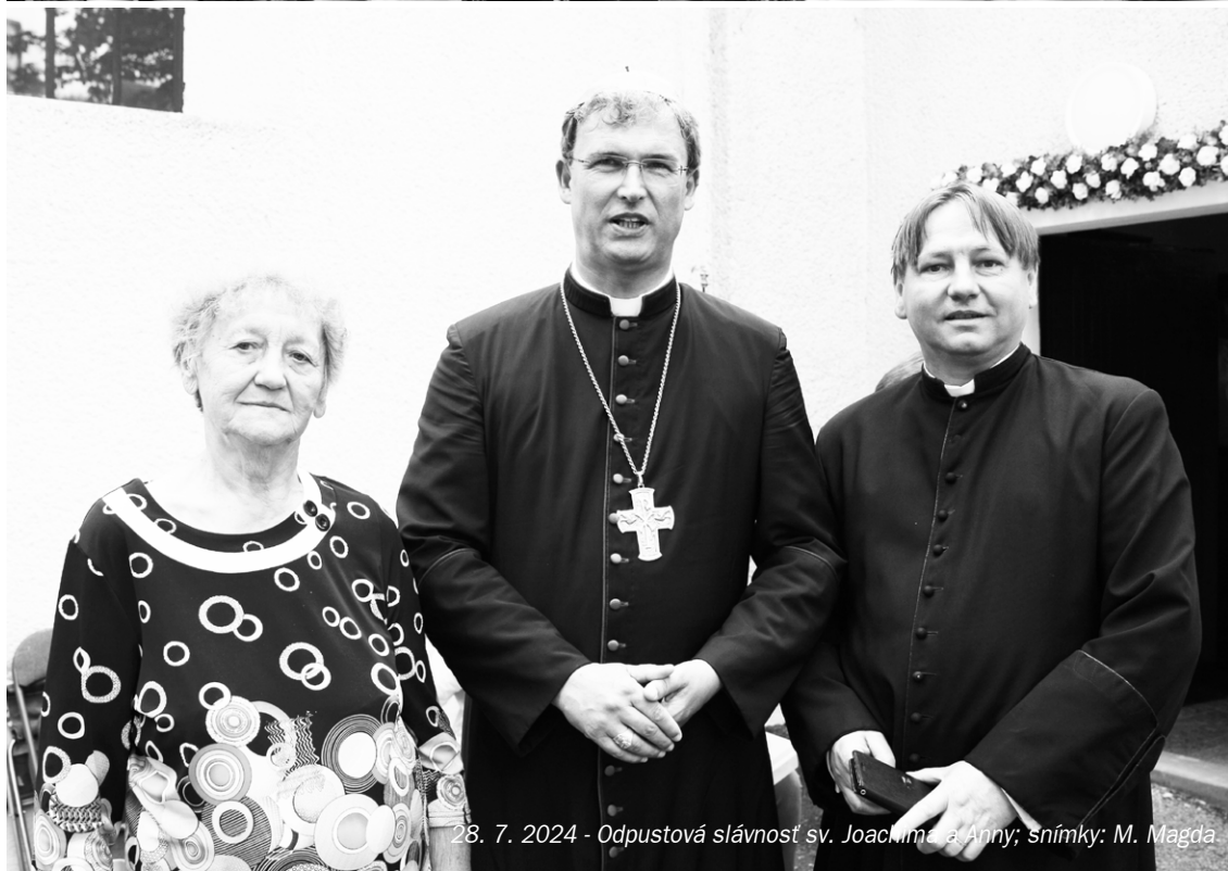
28. 7. 2024 - Odpustová slávnosť sv. Joachima a Anny