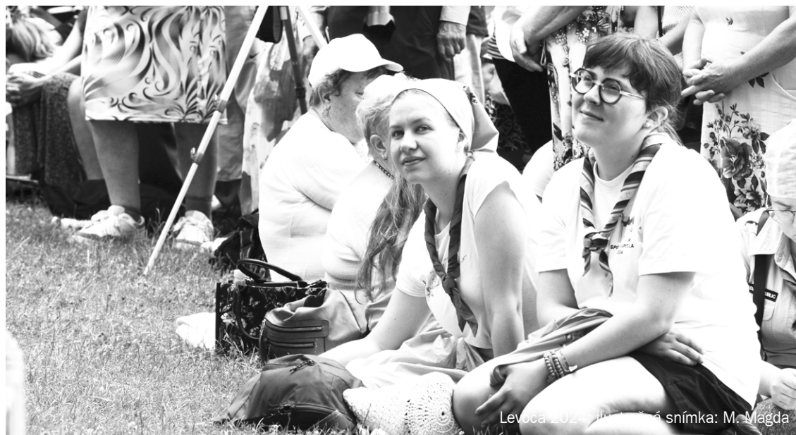
Levica 2024. Ilustrácia: snímka: M. Magda

Používanie pornografie je ťažkým hriechom, ktorý zotročuje človeka a narúša jeho vzťah s Bohom. Boh zmi je zlo pornografie a uzdraví to, čo bolo v človeku zranené. Preto je veľmi dôležitá duchovná terapia, ktorú poskytuje Božia láska.