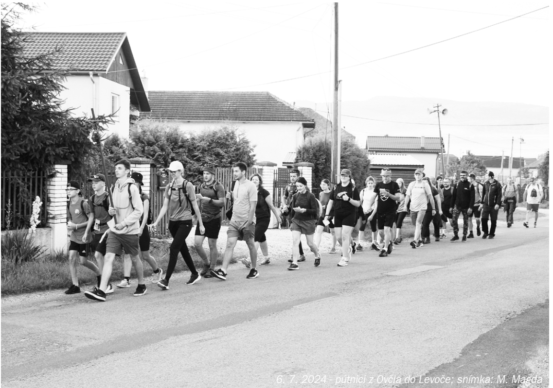
6. 7. 2024 - pútníci z Ovoclá do Levoče