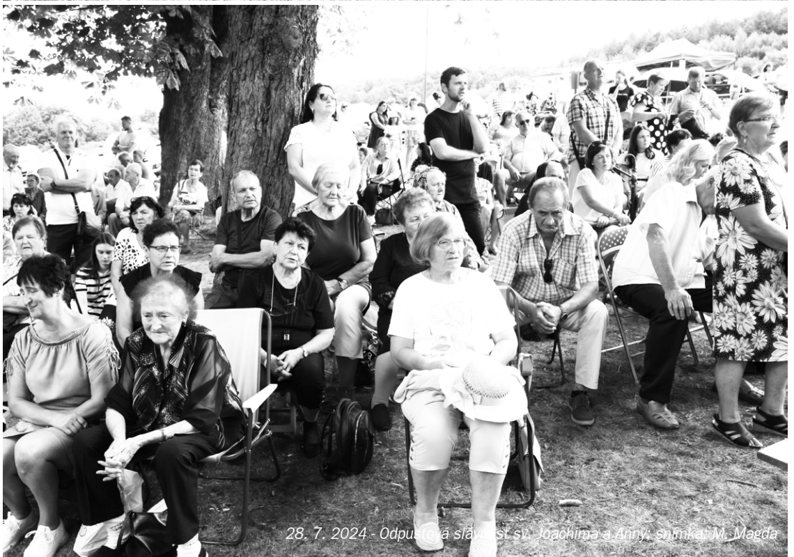
28. 7. 2024 - Odpušková slavnost sv. Joachima a Anny