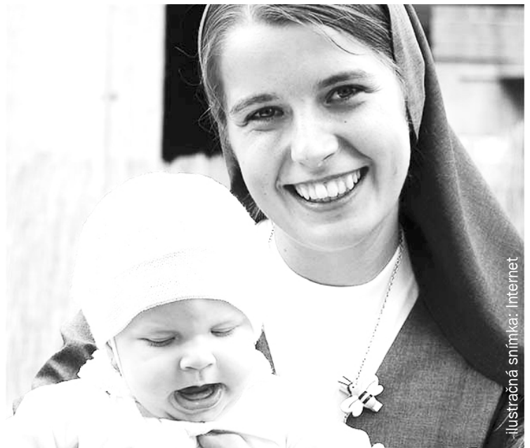
ilustračná snímka: Internet