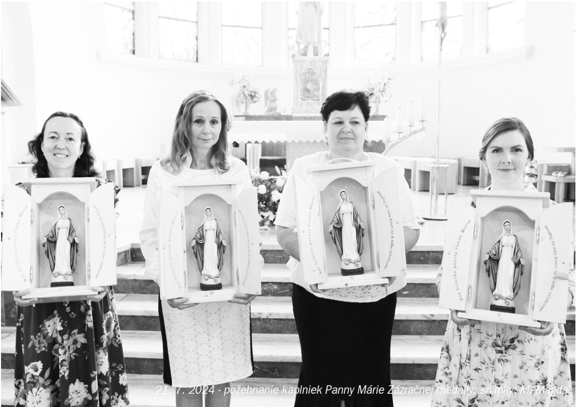
21. 7. 2024 - požehnanie kaplniek Panny Márie Zázračnej medaily