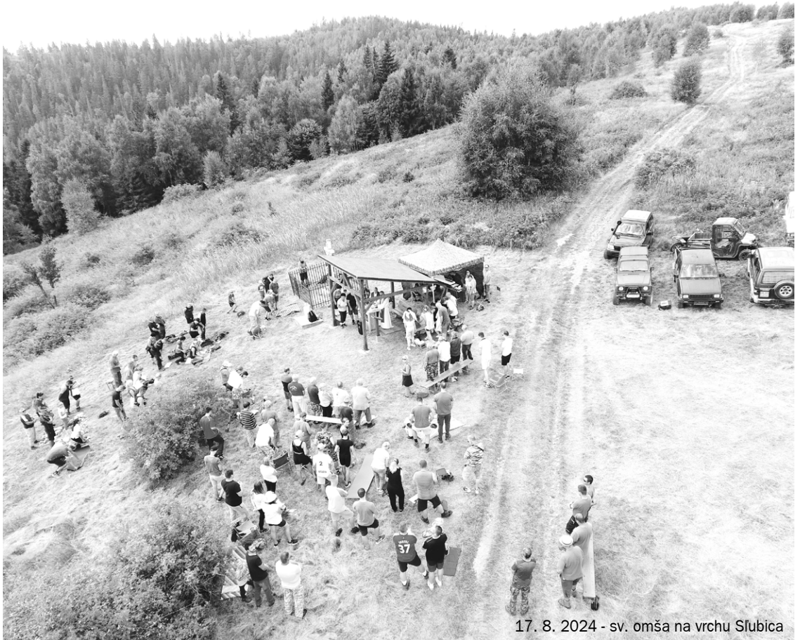
17. 8. 2024 - sv. omša na vrchu Slubica

Základnou oporou v boji za čistotu je modlitba, sviatosti a adorácia Najsvätejšej sviatosti. Je veľa zračných návratov k čistote, keď ľudské úsilie podporili tieto mimoriadne opatrenia. Druhým rozmerom postoja k čistote je čistota vo vzťahoch. Boj o čistý vzťah môže byť dôležitým prvkom rastu pre oboch mladých ľudí. Navyše zamilovaný chlapec alebo dievča má veľmi silnú motiváciu vynaložiť úsilie pre svojho milovaného. Preto je dôležité, aby mladí ľudia bojovali za čistotu ako pár a navzájom sa podporovali. Kvalita ich vzťahu závisí od čistoty ich oboch. Bez čistoty oboch ľudí nezažijú pravú, čistú a šťastie rozdávaciu lásku.