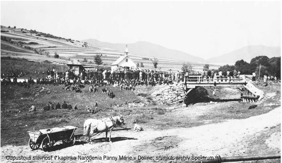
Odpustová slávnosť v kaplnke Narodenia Panny Márie v Doline

Asi dva týždne pred vianočnými sviatkami niektorí sedliaci v Krakovci mali už dobre vykŕmených bravov a chystali sa na zakáľacky. Dobré im padlo, aby si počas zimy a sviatkov prilepšili vo svojej jednoduchej strave. K fazuli, hrachu a kapuste bolo treba dať do žalúdka aj niečo výživnejšie. Údené rebrá alebo šunky, oškvarky či klobásky im veľmi chutili, najmä keď ich „pokropili“ dobrou slivovicou alebo hruškovicom.