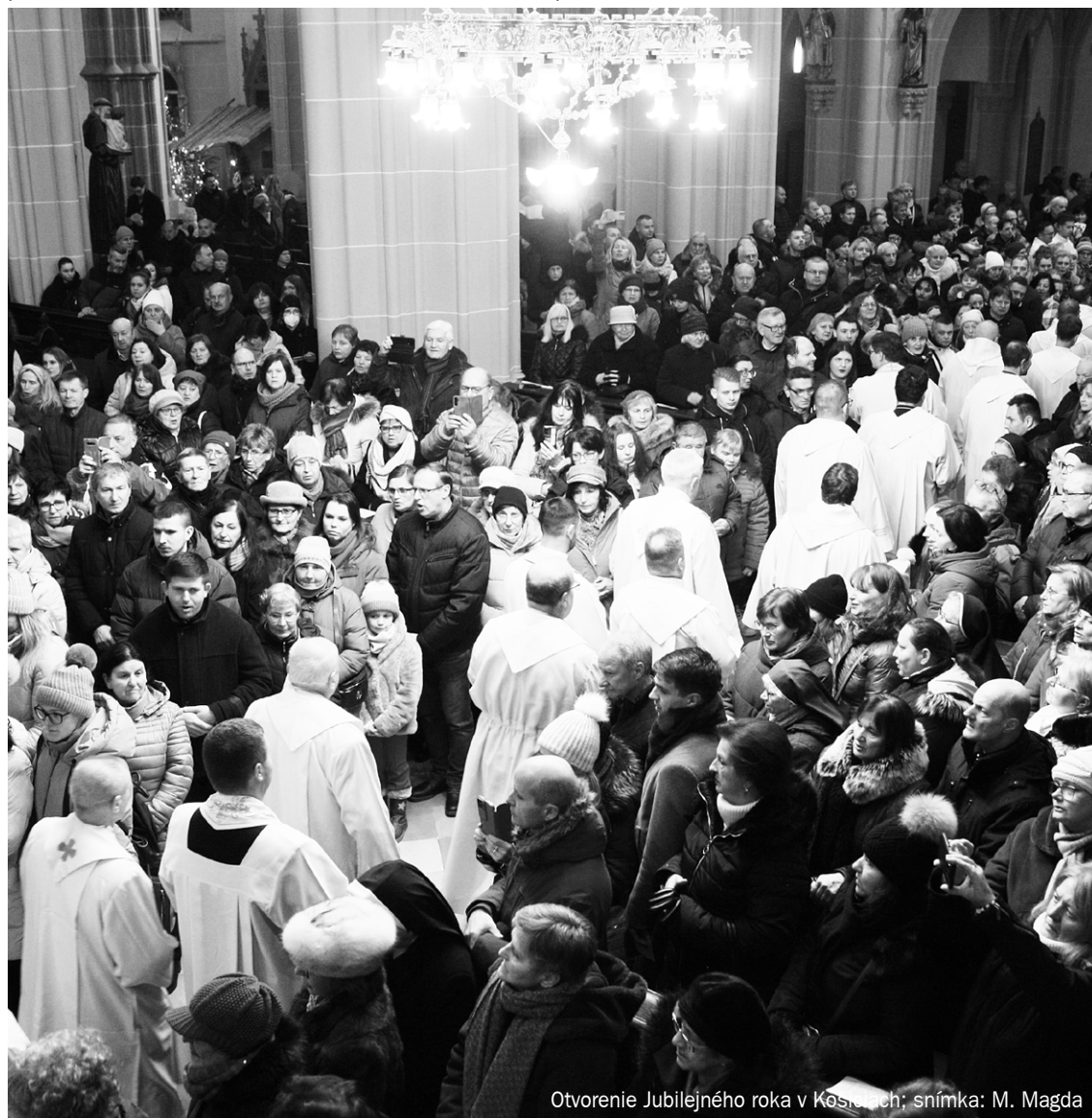
Otvorenie Jubilejného roka v Košiciach

• 31. 12. v utorok na Silvestra bol otvorený kostol od 23.00 do polnoci pre tých, ktorí chceli privítať Nový rok pred Sviatosťou Oltárnou; o 24.00 bolo Eucharistické požehnanie