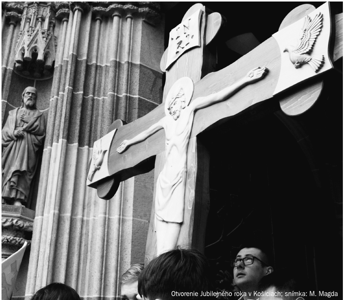
Otvorenie Jubilejného roka v Košiciach

Dediny Krakovec a Mokranec v toku času a dejín zanikli, ale ľudia na Šariši dodnes vyprávajú o huncústvach pastiera Janka. Ba niektorí odvážlivci ich aj v nasledujúcich desaťročiach a storočiach zopakovali. Vraj, aby sa na ne nezabudlo.