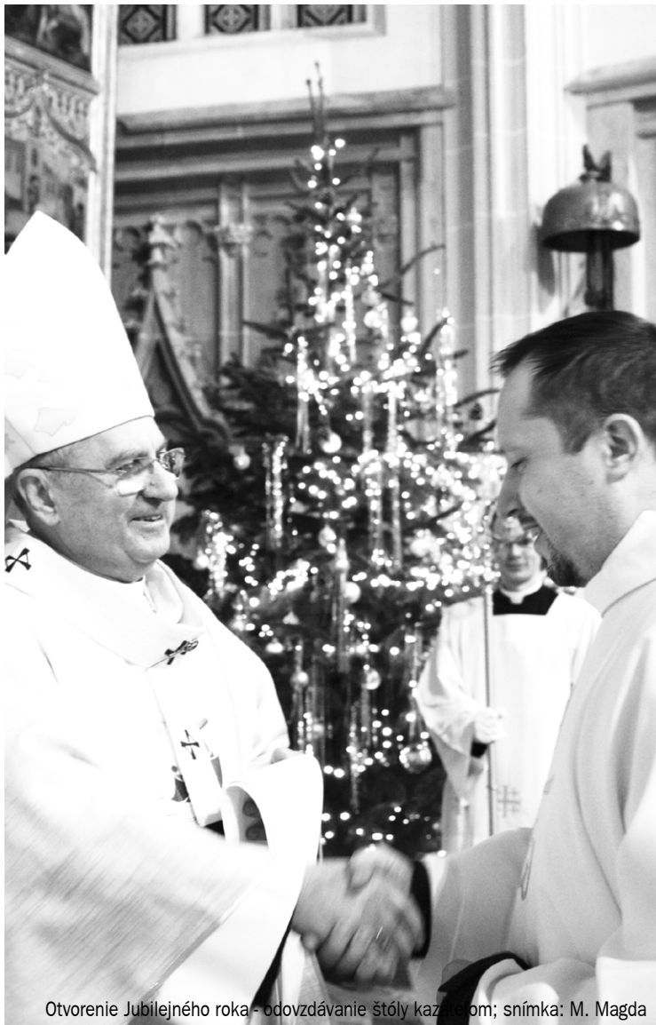
Otvorenie Jubilejného roka - odovzdávanie štóly kazateľom

Boh povoláva človeka k životu bez jeho súhlasu, ale môže mu dať plné šťastie, len keď človek dobrovolne prijme dar Božej lásky, ktorá ho zbožštuje. Pred prvotným hriechom boli ľudia šťastní, ale bolo to šťastie vo vývoji. Svoju plnosť malo dosiahnuť až v momente zbožštenia ich ľudskej prirodzenosti prostredníctvom moci Božej lásky, slobodne prijatej skrze vieru. Všetko prekazil satan - „otec lži“.